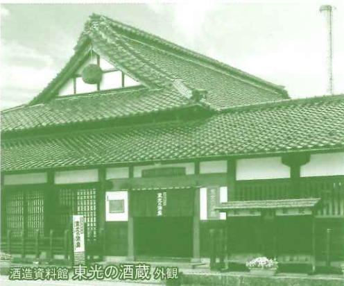
酒造資料館 東光の酒蔵 外観