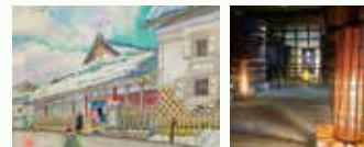
▲お店スケッチ展「東光の酒蔵」 ▲木のあかり展